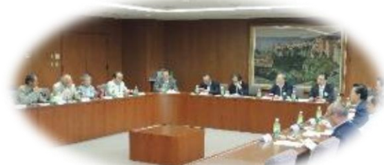
クラブアッセンブリー 4F 特別会議室