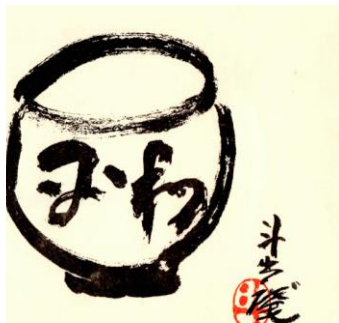
平和 茶碗の図 人間国宝 荒川豊蔵氏描 多治見西 RC 創立 10 周年記念誌より 右写真 虎溪山開山堂