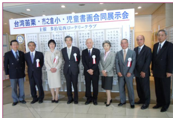
4月25日（水）交換書画展初日より