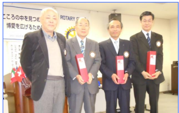
マルチプル・フェローピン授与