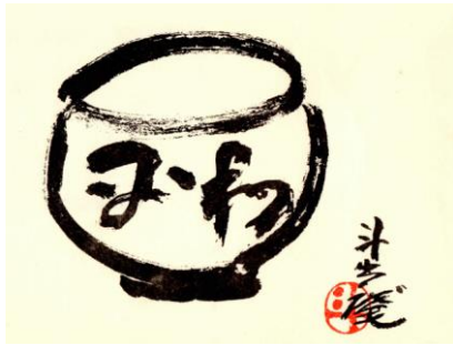
平和 茶碗の図 人間国宝 荒川豊蔵氏筆 多治見西 RC 創立 10 周年記念誌より 右写真 平成 23 年 虎溪山永保寺