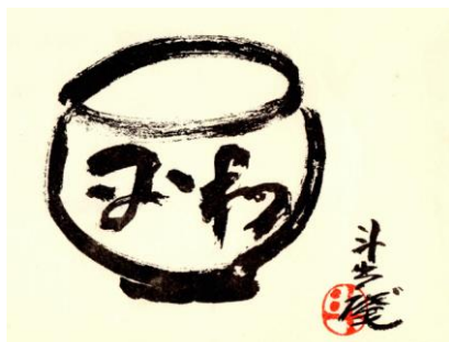
平和 茶碗の図 人間国宝 荒川豊蔵氏筆