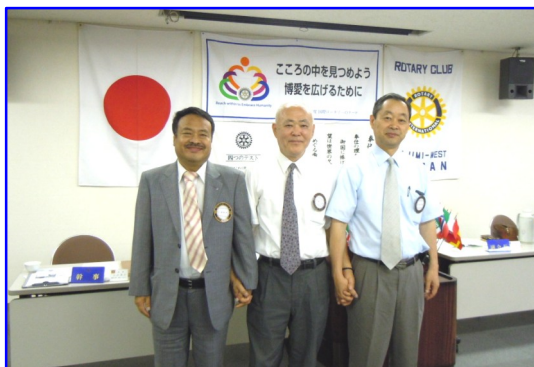
新会員入会式（7月7日）