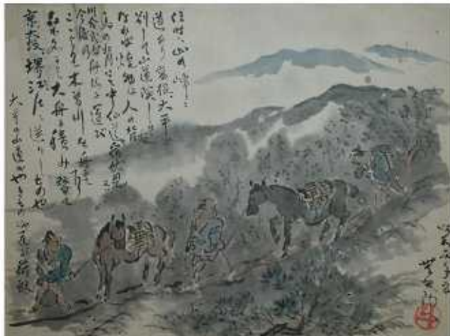
「険道運荷駄図」 文化勲章受章者 荒川豊蔵氏描