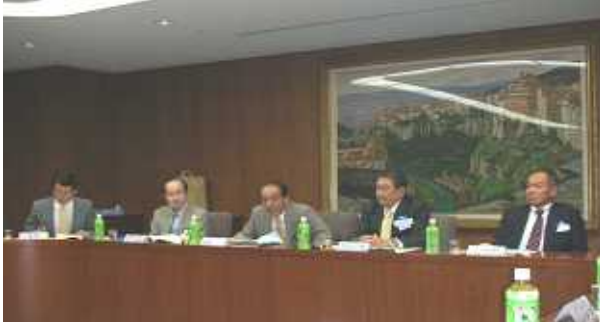
クラブアッセンブリー