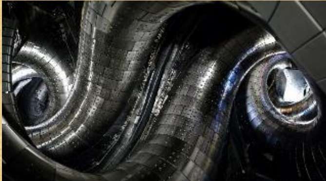
核融合発電を目指す大型ヘリカル装置 (岐阜県土岐市)